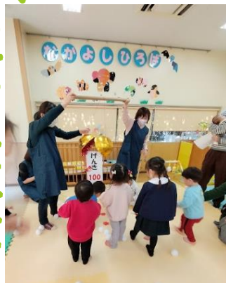
やった~! くす玉が割れたよ!

みなさんにもご協力をいただき、あちこちに笑顔の花が咲く、春らしいお楽しみ会となりました。「とても楽しかった。」「心に残るお楽しみ会だった。」と温かいお言葉をいただきました。大変ありがとうございました。