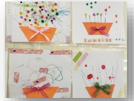
ひろばの壁に きれいな花が咲きました

HP https://www.narita-sanridukanakayoshi.com