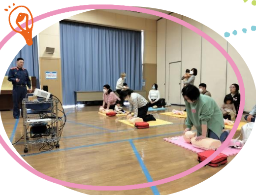
人工呼吸や AED の体験学習